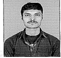
Photo and Signature